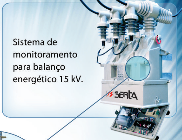
Sistema de monitoramento para balanço energético 15 kV.