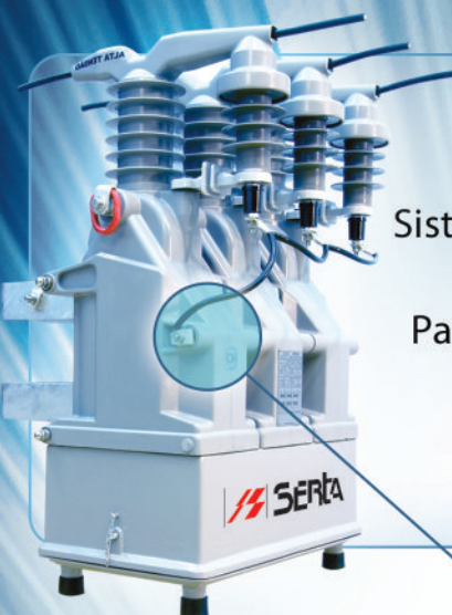
Sistema de medição externo 15 kV. Para faturamento e monitoramento.